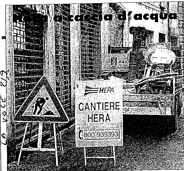
Domani e martedì, dalle 7 alle 19, chiusa alla circolazione via Magnapassi, per consentire interventi di Hera che eseguirà lavori di ricerca riguardanti una grossa perdita d'acqua nel sottosuolo

LUGO - Appuntamento a quattro zampe questo pomeriggio al parco del Tondo di Lugo. Nell'area verde di viale Orsini, infatti, si svolge la rassegna cinofila "Quel peloso del mio amico", organizzata dall'associazione di volontariato del Cinoservizio e aperta a tutti i cani, meticci e di razza. Le iscrizioni sono aperte dalle 16 alle 16,55, mentre l'inizio sfilata è previsto per le 17. A seguire le premiazioni. E' prevista per il 15 settembre, invece, la cerimonia di premiazione della seconda edizione del concorso fotografico "C'è sempre un cane", promosso dall'Enpa lughese, in collaborazione con il Comune di Lugo. Il concorso ha registrato grande interesse, molte delle opere inviate, infatti, provengono da fuori regione. La premiazione del concorso avrà luogo presso le Peschiere della Rocca, alle 18, alla presenza del sindaco di Lugo Raffaele Cortesi e dei fotografi naturalisti Milko Marchetti e Sergio Stignani. Per ulteriori informazioni è possibile consultare il sito www.pergialtri.it/cinoservizio .