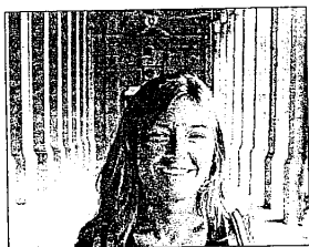
Le vincitrici del concorso