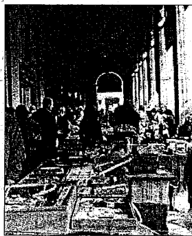
Un mercatino in centro storico

Gli appuntamenti successivi con i negozi aperti di domenica sarà per il 14 ottobre, ancora in occasione del mercatino dell'antiquariato, e per domenica 28 ottobre, quando si svolgerà la fiera d'autunno, il mercato straordinario.