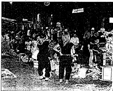
Uno dei mercatini allestiti in centro storico a Lugo

Al di là del programma specifico della serata non mancano, come sempre, le esposizioni di auto in Largo della Repubblica e in piazza Trisi, le animazioni spon-