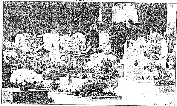
Il cimitero di Lugo, per il quale sono previsti lavori di allargamento

La struttura occupata da tombe monumentali protette dal vincolo della Sovrintendenza, offrirà spazio a venti nuove tombe, la cui realizzazione è stata chiesta, anche in questo caso, con forza dai residenti della zona.