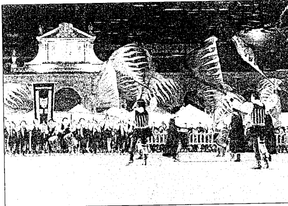
Esibizione di alcuni sbandieratori nella piazza di Lugo

Giungeranno a Lugo squadre di tutta Italia: Faenza, Ferrara, Copparo, Cento, Forlimpopoli, S. Margherita d'Adige (Pd), Bisignano (Cs), Arquà Polesine (Ro), Carovigno (Br), Querceta e Ripa di Seravezza (Lu), San Quirico d'Orcia (Si), Medaglino San Vitale (Pd), Volterra (Pi), Cava dei Tirreni (Sa), Ascoli, Busnago (Mi) ed Asti.