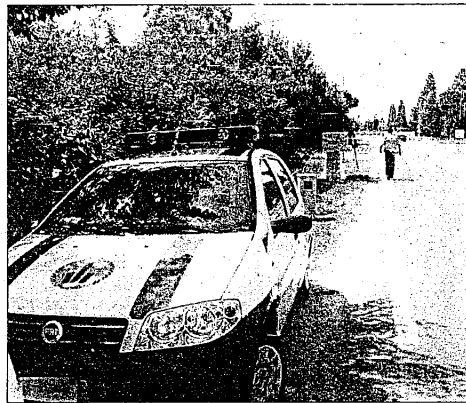
Pattuglie di polizia municipale in servizio nel Lughese

di dare omogeneità organizzativa e di trattamenti, consentendo, allo stesso tempo, un lavoro maggiormente coordinato di tutte le forze dell'ordine sul territorio. Su questo obiettivo serve coerenza anche da parte delle organizzazioni sindacali».