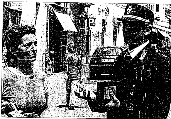
I vigili di quartiere già presenti in altre città presto saranno operativi anche a Lugo

Il segretario Fiorentino: «Un servizio essenziale che non può essere ulteriormente differito»