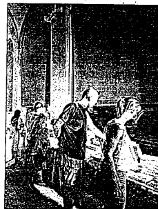
Una Lugo da vivere