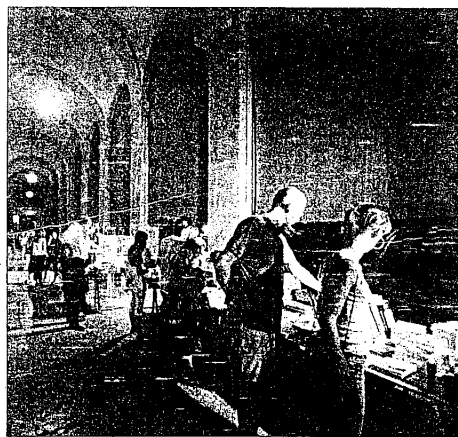
Spettacoli, mercatini e gastronomia il mercoledì sera

Da vedere anche "La Natura in Piazza", un mercatino del biologico all'interno del Pavaglione e uno spazio d'improvvisazione artistica, a libera disposizione per artisti o potenziali artisti. Il Centro Studi Danza di Lugo propone, a partire dalle ore 21,30 circa, il musical "sorrìdi al nuovo ospite", sul monumento di Baracca.