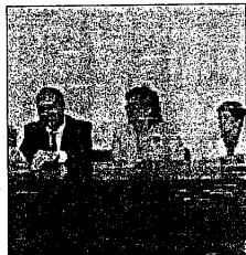
La presentazione del servizio

Anche l'Umberto I dispone ora di un separatore cellulare