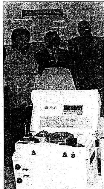
A sinistra la inaugurazione simbolica della nuova macchina, il separatore cellulare che si vede in dettaglio nella foto a destra

Un'opportunità che si sta studiando per venire incontro alle esigenze dell'utenza lughese, che sul tema si mostra da sempre molto sensibile. (a.r.g.)