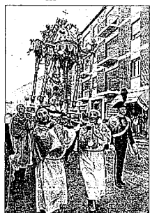
Sant'Ilaro benedice il palio