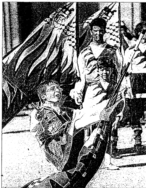
Bandiere e chiarine I colori dei quattro rioni lughesi invaderanno la città per un tuffo nelle tradizioni medioevali

trono e rioni in costume. Alle 20, la corsa di Sant'Ilaro, rivisitazione della corsa quattrocentesca dalla porta del Ghetto a porta Brozzi. E dopo tante "fatiche", intorno alle 21, arriverà finalmente il momen-