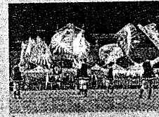
■ Servizio a pagina XVI