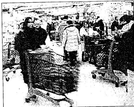
La nascita di un nuovo polo della grande distribuzione è al centro dello scontro fra la Confesercenti e l'amministrazione comunale di Lugo

La Confesercenti contesta i progetti in via di realizzazione sulla Piratello