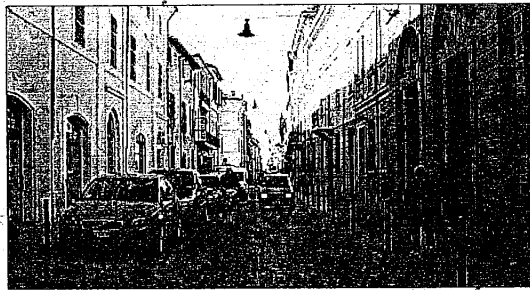
Il fulcro dell'economia solidale lughese si trova in via Garibaldi, al "Chicco di Senapa"

LUGO. Una geografia, quella del commercio equo solidale, che ha una sua tappa fondamentale anche a Lugo. Qui, sta dando ottimi frutti l'attività curata dall'associazione "Amici di Sao Bernardo", alla bottega "Chicco di senapa" di via Garibaldi. Un commercio indirizzato a promuovere la dignità della persona in ogni angolo del mondo, secondo il principio "pace, giustizia e solidarietà nella borsa della spesa", che garantisce un compenso equo e servizi socio sanitari ai piccoli produttori del sud del mondo. Una parte dei fondi serve infatti a finanziare progetti autogestiti a favore delle comunità, per conseguire un livello di vita dignitoso. Altro aspetto importante, l'ambiente e le tecniche di lavorazione, con l'uso di materie prime locali e rinnovabili. Al "Chicco di senapa" i visi-