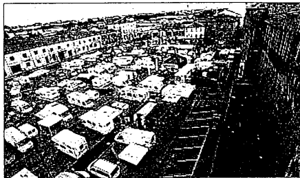
Amarezza per i piloti e gli appassionati

LUGO - Impiccione di un Giove pluvio. Il primo vero giorno di pioggia dell'anno ha aspettato proprio ieri per scatenarsi sopra la Bassa. E a farne le spese è stato il rally "Città di Lugo", il primo appuntamento del Campionato Italiano Motorally, finito con l'annullamento. Peccato, perché la giornata di sabato era stata bellissima e tutto si era svolto nella perfezione più assoluta. I piloti, ben 245 al via, sugli oltre 260 iscritti, avevano affrontato senza intoppi le verifiche di sabato. Poi, ieri, il diluvio. Proprio prima del via, la pioggia è cominciata a scendere fortissima su tutta la Romagna, concentrandosi sulla zona faentina. I piloti hanno lasciato Lugo abbastanza sereni, sicuri di trovare comunque un bel percorso ad attenderli. E invece così non è stato. Al primo controllo orario, a circa 56 chilometri dal via, gli uomini del Moto-club Francesco Baracca - organizzatori del Rally - hanno fermato i piloti in attesa di dichiarare sicura la prima prova speciale. Purtroppo il fondo era troppo rovinato e