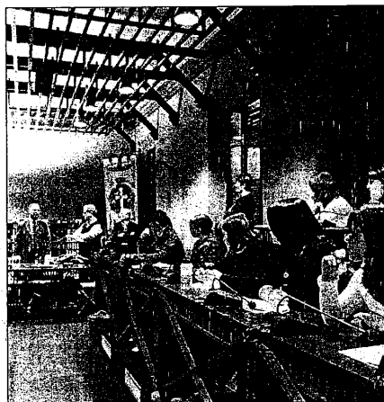
I ragazzi francesi ricevuti dal sindaco di Lugo

"Le laoul" di Bourg Saint Andéol e il collegio "Lis isclo d'or" di Pierrelatte. Bourg St. Andéol si trova nel département (corrispondente alla nostra provincia) dell'Ardeche, mentre Pierrelatte è nella Drome. Durante il loro soggiorno, i giovani transalpini visiteranno Lugo, Faenza, Ravenna e San Marino, Italia in miniatura a Viserba, il Museo Ferrari di Maranello e infine Venezia. I ragazzi italiani andranno a loro volta in Francia il mese prossimo, dal 17 al 24 aprile: la trasferta riguarderà trentaquattro studenti e tre insegnanti accompagnatori.