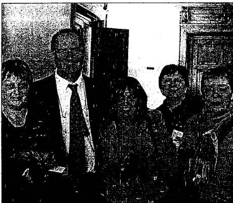
Donne protagoniste nella giornata di oggi

11,30, nella sala del Consiglio comunale festeggeranno questa data importante con tutte le dipendenti. «Tutte le donne che parteciperanno alla loro festa», precisa il primo cittadino Cortesi - avranno in omaggio una primula».