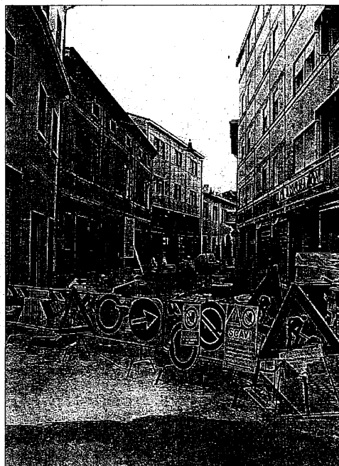
Il cantiere di via Tellarini al centro delle polemiche: l'amministrazione promette la fine lavori in un mese

ulteriormente la già compromessa viabilità. Per ovviare al problema della sosta della clientela i titolari della pasticceria Tiffany hanno ottenuto dal Comune la concessione di due