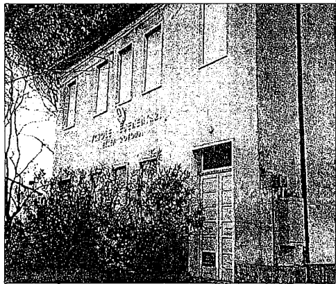
Il Comune ricaverà quattro nuovi alloggi dalla ristrutturazione delle ex scuole della frazione di Bellicetto, attualmente in disuso.

LUGO - Tante le case sfitte, alti canoni di locazione. Pochi gli alloggi popolari disponibili, elevata la richiesta che giunge dalle fasce sociali a basso reddito. Due facce della stessa medaglia, due fotografie che immortalano una paradossale situazione immobiliare. Da una parte l'euforia del mattone che non conosce soste - si costruisce tanto, si vende pochino, si affitta ancor meno - dall'altra centinaia di cittadini in coda per ottenere un tetto, con il Comune dalle casse vuote e le poche case disponibili, piene. Un problema che resta ancora insoluto quello dell'abitazione, un nodo che per tanti immigrati, ma anche per molti lughesi, non è ancora sciolto e va a braccetto con condizioni di vita che rasentano la povertà. La graduatoria stilata dall'Ufficio Casa di via Garibaldi alla chiusura dell'ultimo bando indetto dal Comune per l'assegnazione degli alloggi popolari contava ben 303 richiedenti. Di questi solamente i primi dieci hanno coronato nel corso del 2006 il proprio sogno riuscendo ad ottenere un tetto. Tutti gli altri