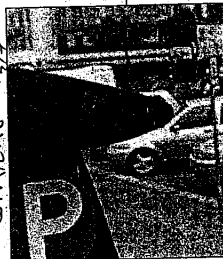
Un parco metro in centro storico