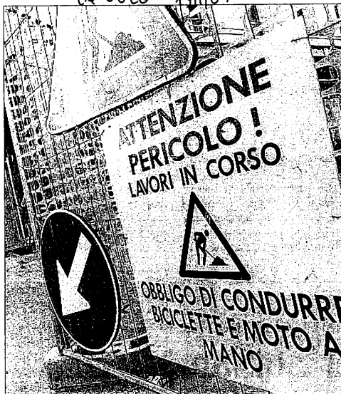
Lavori in corso per 700 mila euro

LUGO - Entra a gamba tesa nell'esercizio finanziario 2007 del Comune di Lugo, Voltana. A poco più di cent'anni dalla sua fondazione, la frazione sarà protagonista del piano degli investimenti. In arrivo, per il completamento del polo scolastico, 200mila euro, che permetteranno alla scuola dell'infanzia di accogliere un'ulteriore sezione. Finanziamenti in vista anche per la zona artigianale, per la cui urbanizzazione sono stanziati altri 100mila euro. Ma l'intervento più atteso si concentrerà nel cuore della città, con l'avvio dei lavori per la ristrutturazione di piazza dell'Unità. Il progetto definitivo, firmato dagli architetti Tiziano Dalpozzo e Giuseppe Romagnoli, dopo un accurato studio tecnico e storico, intende ridare nuovo smalto allo spazio pubblico per eccellenza, attraverso una serie di connessioni e ricuciture del centro con l'intero organismo urbano, in particolare la villa Cacciaguerra-Ortolani, che a breve accoglierà la sede della delegazione municipale. Gli interventi si concentreranno sulla riqualificazione del verde e il riordino dei flussi di traffico. Una piazza come un teatro, con una quinta ideale, costituita, appunto, dal maggior gioiello architettonico del centro, la Villa Ortolani. Non un mero restyling della pavimentazione o un generico intervento di arredo urbano quindi, ma un progetto che intende restituire la sua centralità alla piazza. Il percorso stradale sarà segnalato con materiali particolari, che faranno eco