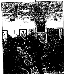
Registrati rallentamenti e blocchi

procedendo all'individuazione delle aree per la sosta dei veicoli, nelle vicinanze delle zone già sede di parcheggi a pagamento». In attesa della risposta ufficiale, a quanto è emerso da alcune considerazioni di componenti il consiglio comunale, il centro di Lugo sembrerebbe però dotato di parcheggi gratuiti sufficienti, nelle vie Amendola, Foro Boario, Acquacalda, Mentana, Miraglia e Compagnoni, e nelle piazze XIII Giugno e Garibaldi. (a.r.g.)