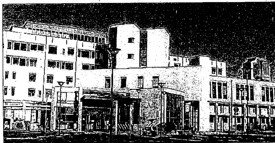
Cup centrale in tilt. A causa di un guasto sulla linea Telecom le prenotazioni si potranno fare solo in farmacia o tramite Cuptel

LUGO - Santa Adsl, la linea è in panne e il Cup di Viale Masi si arrende. Non bastassero i nuovi ticket salasso ora ci si mette anche la tecnologia a giocare brutti scherzi agli utenti. Da giovedì, infatti, lo sportello unico per la prenotazione esami funziona col contagocce. Diverse le telefonate ricevute in redazione da alcuni cittadini che si lamentavano dello stallo totale del servizio. Una sola la risposta che possiamo fornirvi: non sperate sull'Ausl. Rallentamenti e blocchi, infatti, fa sapere la direzione sono dovuti a problemi della linea Telecom. L'Ausl, in attesa di un repentino ripristino del servizio da parte del gestore telefonico - previsto per martedì - oltre a scusarsi con gli utenti per il disagio