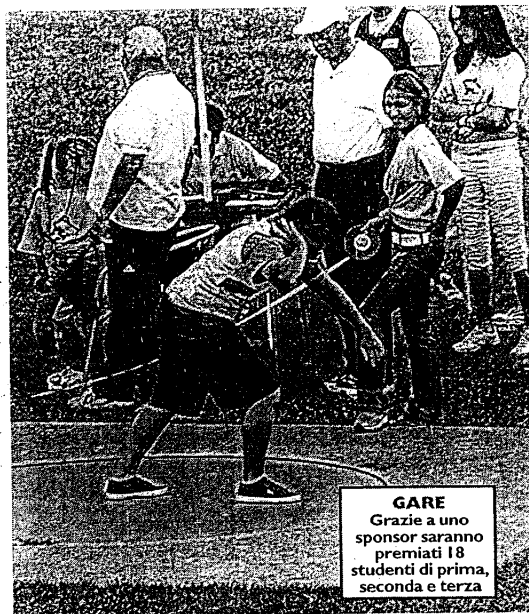
GARE Grazie a uno sponsor saranno premiati 18 studenti di prima, seconda e terza

fermo restando il tempo dedicato allo studio, indispensabile, unitamente alla pratica di una disciplina sportiva, per costruire oltre che un atleta, un uomo o una donna del domani».