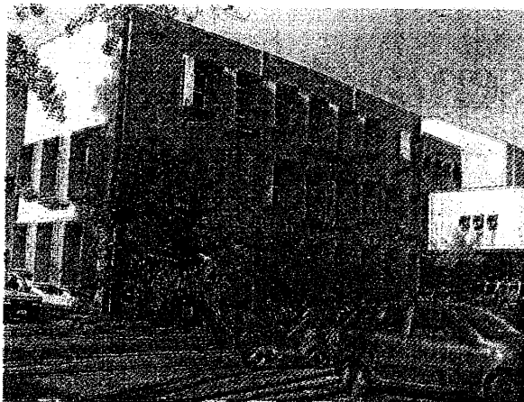
LAVORI La sede del Compagnoni. Il blocco di palestra e spogliatoi sarà bonificato entro maggio

Le manifestazioni della giornata del Tricolore, organizzate da Comune, Unione nazionale ufficiali in congedo e Lions Club, previste per il 13 gennaio, sono state rinviata a febbraio (data da destinarsi), per favorire la presenza del presidente del Senato, Franco Marini, dichiaratosi interessato a partecipare al convegno. Il presidente Marini, seconda figura istituzionale dello Stato, potrebbe dunque essere a Lugo per festeggiare il tricolore e la figura di Giuseppe Compagnoni.