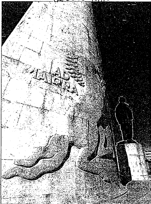
Piazza Baracca, monumento compreso, sarà oggetto di un intervento di riqualificazione da un milione di euro