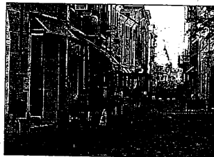
Il patrimonio comunale esposto in vetrina nelle botteghe del centro