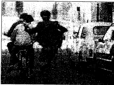
I recenti episodi di microcriminalità hanno allarmato i commercianti

Partendo proprio da tali considerazioni comuni,