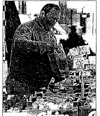
Alimentazione e complementi d'arredo tra il Pavaglione e largo Baruzzi

LUGO - Si riconferma l'appuntamento più verde della Bassa Romagna, con il mercatino del biologico ed erboristico, in programma oggi a Lugo. Un momento importante per apprezzare la natura direttamente raccolta e venduta dagli agricoltori biologici del territorio, ma non solo; ci saranno anche i vini, i formaggi e i prodotti del forno a fare bella mostra di sé sotto le logge del Pavaglione e largo Baruzzi. Si avrà modo così di potere riscoprire "antichi sapori" recuperando, perché no, un contatto più sano e salutare con ciò che ci viene offerto dal territorio agricolo in cui viviamo. Ma benessere e salute non sono solo alimentazione, ma anche arredo e bioedilizia. Saranno così presenti due negozi che si occupano ampiamente di questo aspetto del naturale: i "cugini toccasana" di Alfonsine e "armonia" di Imola, che esportano vari complementi di arredo e ciò che può servire per mantenere sana la casa. Alcune erboristerie del territorio proporranno inoltre tisane, integratori e cosmetica naturale. Ventidue saranno gli espositori presenti, per una piccola ma importante manifestazione.