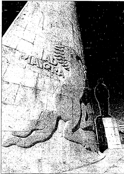
Piazza Baracca presto sarà tirata a lucido

Entro il 2007 sarà poi tirata a lucido anche la Rocca lughese. Per la residenza municipale - da mesi oggetto di profondi restauri già messi a preventivo nell'attuale piano investimenti, il Comune sborserà altri 500mila euro. Il 2007 potrebbe essere l'anno decisivo anche per la realizzazione del Campus scolastico, ambizioso progetto cui spetta alla Provincia l'ultima parola. Sul campus, però, l'assessore frena: