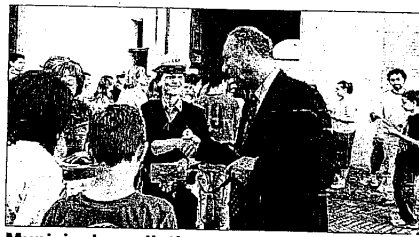
Municipale e piloti professionisti daranno lezioni teoriche e pratiche agli studenti

LUGO - Tutti a scuola di educazione stradale. Nell'ambito della manifestazione "Rombi di passione", che si chiude a Lugo nel primo giorno di ottobre, si svolge domani la "Giornata dell'educazione stradale". "Si tratta di un appuntamento importante - sottolinea il sindaco di Lugo Raffaele Cortesi - di un momento educativo che coinvolge i ragazzi delle terze medie di Lugo, Bagnara e Sant'Agata sul Santerno. Sono loro il nostro futuro e credo siano loro le persone per le quali dobbiamo avere un occhio di riguardo". La polizia municipale sarà mobilitata per essere da supporto all'iniziativa inserita in "Rombi di Passione", iniziativa fortemente voluta dallo stesso Massimo Melandri, il coordinatore dell'evento". Il patentino per