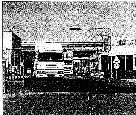
Grazie alla realizzazione del raccordo ferroviario gli olii vegetali non viaggeranno più sui mezzi pesanti

blemi derivanti dal traffico dei mezzi pesanti». Se per la firma sull'accordo sembra essere questione di giorni, alla riunione della Conferenza dei servizi in programma domani, venerdì, a Bologna, l'Unigrà si presenterebbe, come detto, con questa nuova importante 'carta da giocare', cioè della raggiunta intesa con le Ferrovie, che potrebbe far pesare definitivamente l'ago della bilancia a favore della realizzazione della centrale. Il parere definitivo sul progetto però non dovrebbe essere dato nella riunione di domani, proprio perché l'incontro sarà utilizzato per esaminare gli ultimi dettagli sul progetto e anche perché devono passare 45 giorni (dalla pub-