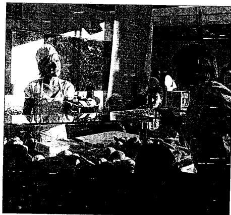
Uno degli stand allestiti alla Fiera Biennale