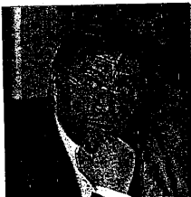
Il presidente della Regione Vasco Errani

Sono in arrivo 79mila euro La Regione fa il tifo per la Bassa Romagna