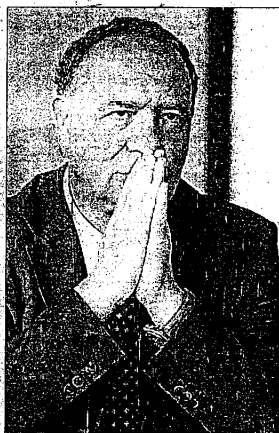
Cortesi ha seguito l'incontro con Andreotti e Mastella

realità molto precise. Tutti noi abbiamo bisogno di trovare un'ispirazione per le nostre attività, e in questo la tensione ideale non può mai venir meno". Crocchia di in-