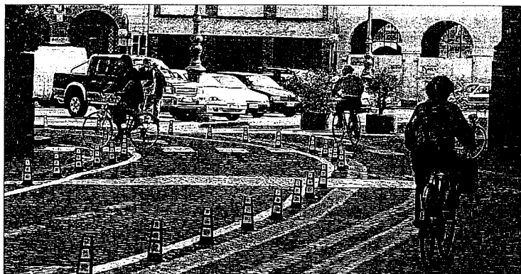
Petizioni e riunioni a raffica nel lughese per ottenere percorsi a misura di ciclista

LUGO - Piste ciclabili da fare e rifare. I cittadini lughesi amanti delle due ruote, residenti in città e nelle frazioni, indicano le priorità per una circolazione in sicurezza. In cima alla lista delle opere infrastrutturali urgenti, virtualmente stilata dai lughesi, vi è la necessità di realizzare un collegamento ciclabile tra San Potito e Lugo. La richiesta cittadina è stata espressa anche durante l'ultima riunione di circoscrizione alla quale hanno preso parte anche i promotori della petizione presentata in Comune nel maggio scorso con l'obiettivo di ottenere una pista ciclabile che colleghi via Argine Senio Destro e via Confini Levante con Corso Dante. Questo tratto di strada che da San Potito sbuca sulla trafficatissima San Vitale non era ancora stato preso in considerazione dall'amministrazione che, negli incontri precedenti con i cittadini della frazione aveva individuato via del Pero come asse della futura ciclabile. La richiesta dei cittadini lughesi residenti tra Corso Dante, via Argine Senio Destro e Via Confini Levante, che sinora hanno raccolto oltre 300 firme, si affianca, quindi a quella degli abitanti di San Potito. I due fronti hanno un obiettivo comune: veder realizzato un percorso che permetta di raggiungere la città senza rischi. Come accontentare entrambi i fronti popolari? E' questo il rebus che ora deve sciogliere il Comune. L'assessore ai Lavori pubblici Se-