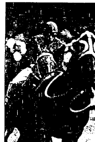
Destrieri pronti alla sfida

adine, dinanzi alla basilica, proprio come la più celebre tenzone toscana. L'evento equestre rappresenta il clou della sagra, festa del paese che si ripete dal 1972 e che quest'anno si terrà dal 24 al 30 agosto. L'inaugurazione della festa è fissata per giovedì alle 18. Ad aprire la 27a edizione sarà una gara di ciclismo giovanile "fuoristrada" organizzata dal Velo Sport Conselice e valida quale secondo Trofeo Agostina Salami (iscrizioni 335-6577919). Ritrovo