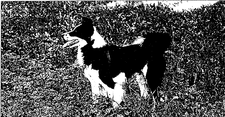
"Diamoci la zampa": i simpatici ospiti del canile chiedono più rispetto all'uomo