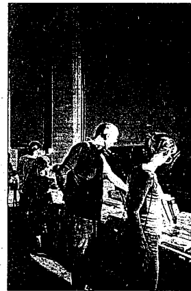
Appuntamenti e curiosità per grandi e piccini

apertura straordinaria del Museo Francesco Baracca e della galleria Artepù, che ospita la mostra di pittura "Viandanti" di Bedeschi e Pilò. Sempre in via Baracca,