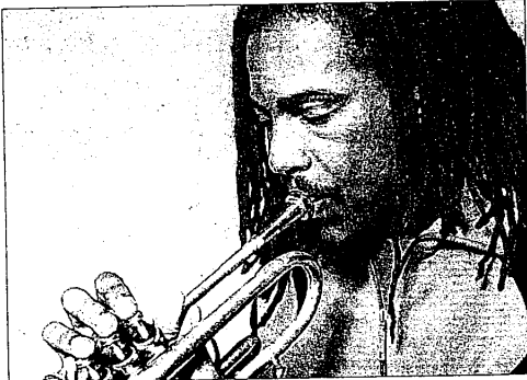
Il trombettista Roy Hargrove aprirà "Lugo Musica Estate"

LUGO - Sotto le ali di Baracca, sotto le stelle di Lugo. Musica senza tempo, musica che ha fatto storia. L'estate lughese vibra improvvisa e improvvisando plana sulle corde del miglior jazz mondiale. Anche quest'anno il capoluogo bassoromagnolo si trasforma nella capitale della contemporaneità dell'arte. Dopo le incursioni nella sperimentazione del Lugo Opera Festival, dalla magia del Pierrot Lunaire di Busoni, all'alchimia electro-emozionale del maestro Stockhausen, sarà il jazz dei grandi interpreti americani ed europei l'assoluto protagonista delle serate musicali lughesi. Due le rassegne musicali in programma tra luglio e agosto. Giunge, infatti, alla XXIV edizione "Lugo Musica Estate", manifestazione dedicata alla magia dell'improvvisazione, arte unica che accompagna jazz e world music. Promossa dalla Fondazione Teatro Rossini in collaborazione con Jazz Network, Regione Emilia Romagna, Provincia di Ravenna, la manifestazione si svolgerà dal 6 luglio all'8 agosto, all'interno del Chiostro della Banca di Romagna (Corso Garibaldi, 11. Spettacoli ore 21.15). Non solo jazz, comunque. A ravvivare il panorama artistico della provincia provvederà anche l'associazione culturale Lugo Contemporanea (fondata da John De Leo, Monia Mosconi e Franco Ranieri) che, alla luce dei buoni riscontri ottenuti l'anno scorso dall'esperimento di contaminazione tra discipline e arti diverse realizzato all'interno del ristorante Baraká, ripropone in versione estiva