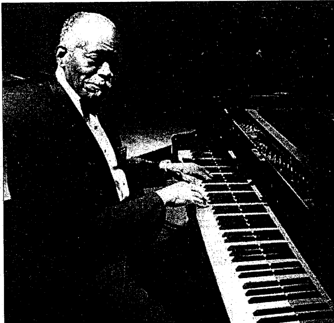
La stella più brillante della rassegna è Hank Jones, che sarà a Lugo l'11 luglio. Il pianista americano, che compirà 88 anni pochi giorni dopo il concerto lughese, è una leggenda del jazz del secolo scorso, che ha attraversato suonando con i più importanti nomi