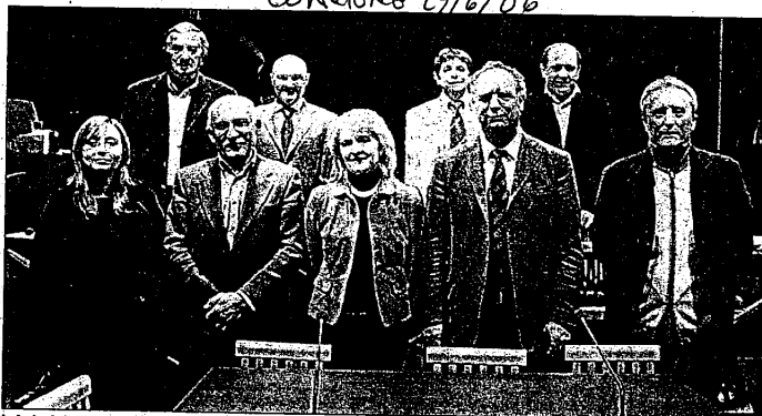
I sindaci di Alfonsine, Bagnacavallo, Bagnara, Conselice, Cotignola, Fuisignano, Lugo, Massalombarda e Russi

Stasera in piazza Baracca, show di giovani gruppi musicali