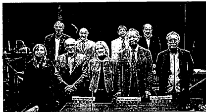
I nove sindaci che hanno firmato l'appello