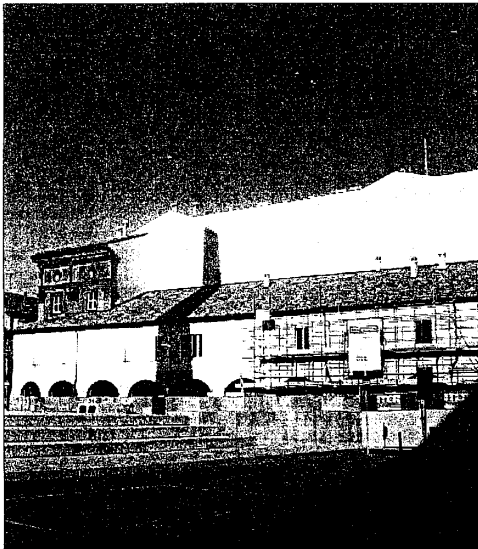
Sotto il porticato è prevista la realizzazione di un Caffè in stile retrò

Ospiterà la Camera di commercio, l'università e la fondazione