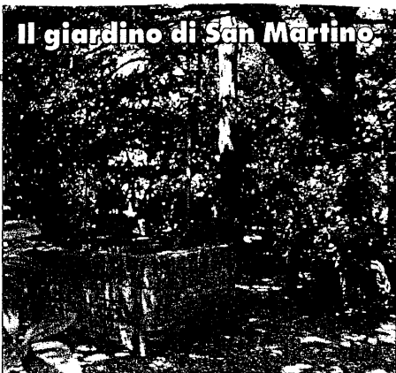
Domani, alle 20, apre i battenti, nel giardino pensile della Rocca, l'Osteria di San Martino "all'aria aperta". Nella serata inaugurale è possibile cenare solo su prenotazione telefonando allo 0545-281928.