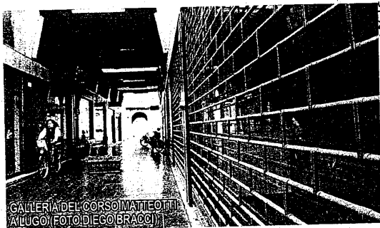
GALLERIA DEL CORSO MATTEOTTI A LUGO