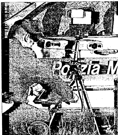
"I vigili sono nascosti poi ti arriva la multa a casa"