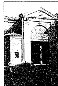
Il Pavaglione, cuore dell'evento

sindacato. Da segnalare, tra l'altro, la premiazione del concorso che ha visto impegnati numerosi artisti nell'ideare originali etichette per il vino della Cevico, che verranno utilizzate per la bottiglia ufficiale del centenario, e la mostra documentaria