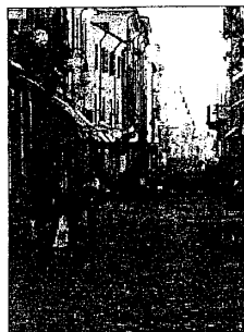
Lugo, centro commerciale naturale