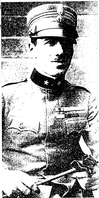
LUGO Francesco Baracca, cavaliere dei cieli e mito italiano

LUGO - Continua con grande successo la mostra "Francesco Baracca, cavaliere dei cieli" al Museo Baracca di Lugo.