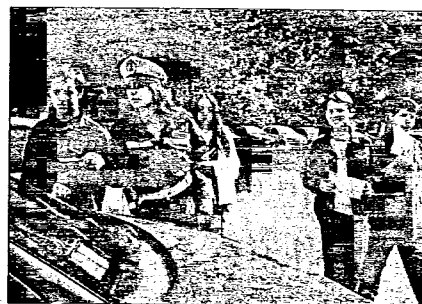
'Città dei Bambini', in programma il 26 maggio. Una vera e propria "lezione" comportamentale agli adulti che, troppo spesso, infrangono le regole del codice della strada, creando pericoli per gli altri, oltre che per se stessi.