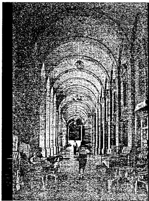
Un parto difficile per il nuovo regolamento che disciplinerà il rilascio delle licenze a bar e ristoranti

Eh sì, perché se il match sino ad un mese fa vedeva Comune e commercianti a distanze siderali in merito ai criteri sui quali basare il rilascio di licenze e sulla