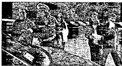
Comune e polizia municipale promotori dell'iniziativa voluta dai ragazzi