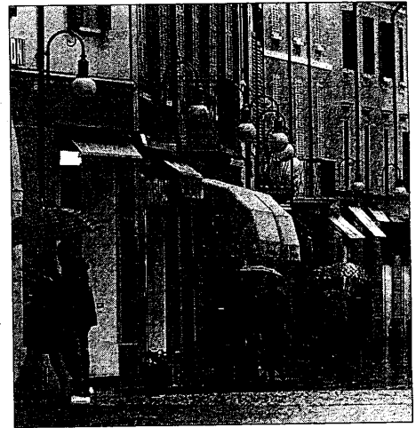
Il nuovo 'ente' vuole valorizzare sempre più il centro storico e le sue attività commerciali

per la promozione commerciale di Lugo: «Il nuovo ente non si pone in antitesi col lavoro portato avanti dai componenti la 'cabina di regia', anzi molti di loro ne fanno parte, e dal Comune, ma vuole fungere invece da supporto per raggiungere obiettivi ancor più prestigiosi. E l'anno è quello giusto, anche in previsione della biennale di settembre». L'ente chiede in sostanza al Comune di essere parte della gestione di 'Lugo Città Mercato', aiutando la stessa amministrazione nell'individuare professionisti che possano far decollare ulteriormente le iniziative. Altro punto su cui spingono i promotori della nuova 'associazione' è moltiplicare le