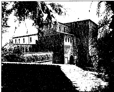
Si possono visitare dal lunedì al venerdì (ore 9/18,30) e nella mattinata del sabato (ore 9/13)

L'oasi naturale del Castello rimane chiusa la domenica e nelle giornate festive.