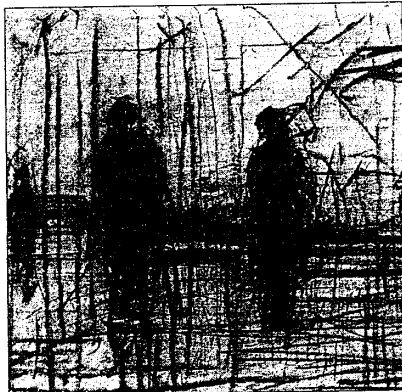
I viaggi di Zambeccari di Alberto Zamboni, in esposizione fino al 23

"La mia pittura - racconta Zamboni - nasce dall'idea di viaggio, una scoperta che si svela attraverso le luci e l'ombra, compie a volte rapidi sguardi su cose, figure e soggetti vari che vivono tutte intorno e finiscono in un contesto atmosferico, senza tempo". Una pittura monocromatica, quella di Zamboni, che raccoglie nella rappresentazione i frammenti di una memoria interiore vivace. Immagini prima nate nella mente, poi sviluppate sulla tela senza l'ausilio di nessun apparato tecnico-fotografico. Le ultime figure rappresentate e nominate "figure dalla polvere" derivano da una idea di corrosione del tempo, una corrosione calda, desertica e vicina ai caldi miraggi di Saint Exupery nella sua polverosa Cittadella. Un'altra immagine è quella delle figure che si affacciano all'acqua, alla ricerca di un'anima