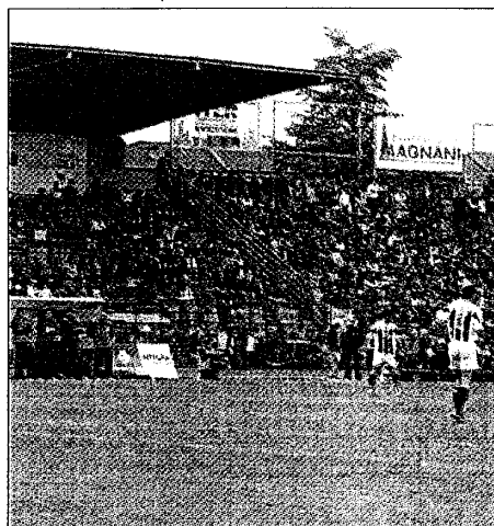
Lo stadio 'Muccinelli' è uno dei 14 campi esistenti nel territorio comunale di Lugo.

e San Lorenzo; quattro i circoli tennis (Lugo, San Bernardino, Villa San Martino e Voltana). E 23 sono le palestre, fra scolastiche di proprietà comunale e provinciale e private, due le piste da skateboard (nelle vie Colombo e Madonna delle Stuoie a Lugo). L'elenco si allunga poi con il campo da tamburello in via Bach, il 'percorso vita' ai giardini del Tondo, i tre campi da bocce (dopolavoro ferroviario e Tondo per Lugo e in via Sentiero a Bizzuno), il campo di tiro a volo a Villa San Martino, quello di tiro a segno nazionale a Lugo in via Piratello, le due piscine comunali, una coperta ed una scoperta sempre a Lugo accanto allo sta-