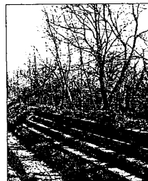
Il Canale dei Mulini