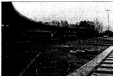
La stazione delle corriere che entrerà in funzione a pieno regime con il sottopasso di via Felisio

stazione sarà completato entro il 2006». A questo punto non resta che attendere e sperare che l'impegno venga mantenuto. Se ciò avverrà, a fine anno il quartiere Madonna delle Stuoie sarà finalmente collegato, almeno per quanto riguarda pedoni e biciclette, al resto della città senza dipendere dal su e giù delle sbarre dei passaggi a livello. E così avrà preso il via anche l'attesissimo progetto Lugo Sud, che a poco a poco andrà a 'stravolgere' l'attuale assetto della viabilità della zona al fine di facilitare lo scorrimento del traffico, togliendo di mezzo passaggi a livello e semafori. E proprio il 2006 dovrebbe vedere anche l'avvio dell'intervento forse più ingente dal progetto, ovvero la realizzazione del sottopasso carrabile di via Felisio, che consentirà di eliminare le attese ai due pas-