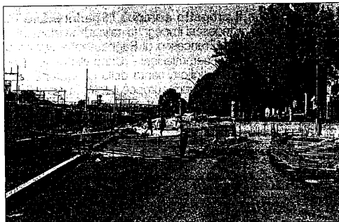
I cantieri rimangono sulla carta, ma non tutto sembra essere perduto

Quarantasei i progetti in lizza per accedere ai finanziamenti regionali nell'ambito del Piano nazionale sulla sicurezza stradale (Pnss). Quattordici i posti disponibili. Quindicesima posizione per il progetto del tandem ravennate-lugheuse. Ad un passo dal podio. Una medaglia di legno che costringe i