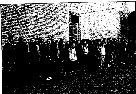
"Francesco Baracca". I ragazzi francesi saranno ospiti di famiglie lughesi fino al 21 marzo. I "nostri" studenti ricambieranno la visita in Francia dal 24 al 31 marzo.

LUGO - Studenti stranieri in visita alla Rocca. Si è trattato di trentasei ragazzi francesi, in età compresa tra i 14 ed i 15 anni, accompagnati da 4 insegnanti dei due istituti di appartenenza, quello di Pierrelatte, nel dipartimento di Drôme sulla riva sinistra del Rodano, e quello di Boure Saint-Andéol, nel dipartimento di Ardèche, sulla riva destra del Rodano. Sono stati ricevuti ed accompagnati, in una sorta di visita guidata, dal responsabile delle attività museali, Daniele Serafini. La visita si svolge nell'ambito di uno scambio culturale e linguistico tra gli istituti francesi e la scuola secondaria di primo grado