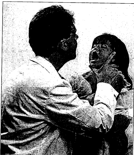
Visita a un bambino: le mamme lottano per la pediatria di Lugo

incontreranno il primo cittadino per esporgli le loro richieste e consegnargli il nuovo documento che verrà predisposto domani. Ciò avverrà proprio alla vigilia della seduta della Conferenza socio-sanitaria territoriale del 22 marzo, dove verrà presa la decisione definitiva riguardo al progetto e quindi anche alla questione 'degenza pediatrica'. «I tempi stringono — affermano le mamme del comitato — e la posta gioco è più che rilevante, perché c'è di mezzo un servizio che riguarda i bambini e che di conseguenza incide in modo