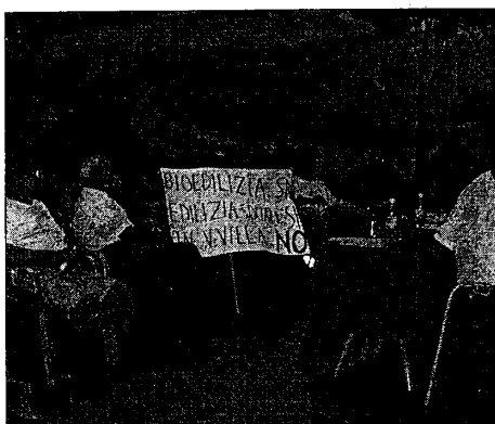
Una precedente assemblea pubblica sulla variante del Canale dei mulini, svoltasi sempre al 'Tondo'

Secondo gli esponenti del 'Dernier regard', «non sono svanite tutte le speranze di fermare la variante. Ci faremo sentire anche alla Provincia e al Consiglio di Stato. Senza dimenticare Lugo Immobiliare e Unibanca»