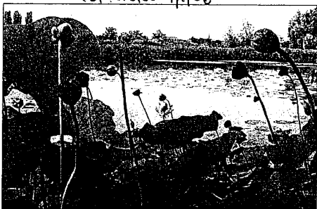
Il Parco del Loto: il mantenimento è complesso e necessita di una costante manutenzione