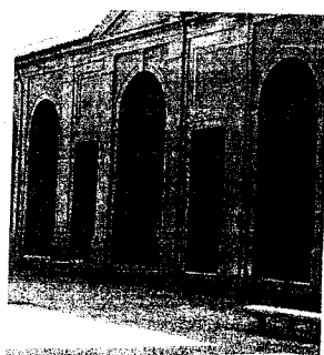
Rinascita del centro

Atteso da anni, l'opera da cinque milioni di euro che mira a cambiare il volto alla viabilità cittadina