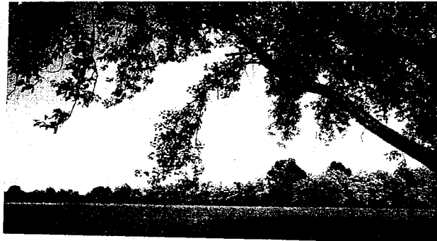
Il Canale dei Mulini

Il Globo fa ombra, il salotto buono merita di più