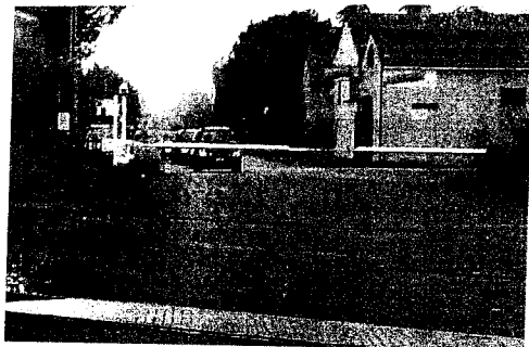
Progetto "Lugo Sud"

Atteso da anni, l'opera da cinque milioni di euro che mira a cambiare il volto alla viabilità cittadina