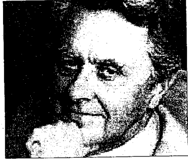
Pietro Citati sarà a Lugo il 3 febbraio