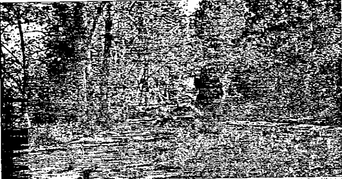
E' stata di recente rivolta maggiore attenzione e cura alle aree verdi e, in generale, alle zone d'interesse storico-ambientale, fra cui il Canale dei Mulini

circa 2500 abitanti, si sviluppa soprattutto nei primi anni '50, abitato in maggioranza da operai che, con grandi sacrifici, riuscirono a costruirsi casa nei successivi anni '60 e '70. "Dopo quella prima espansione, Lugo Ovest divenne statico, non registrando trasformazioni particolari", racconta Dalmonte. Dagli