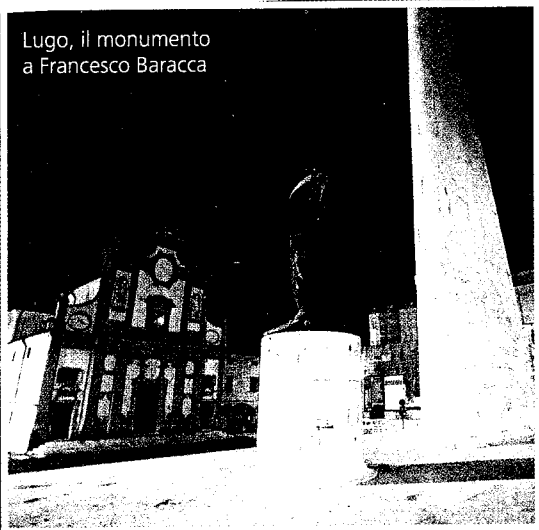
Lugo, il monumento a Francesco Baracca

bilità relativa alla mobilitazione delle merci e delle persone in relazione al prevedibile sviluppo di nuove aree industriali. Da parte di Confindustria è stata sollecitata, inoltre, nei confronti delle varie amministrazioni, una maggiore attenzione al coinvolgimento degli stessi Industriali sulle questioni legate al territorio nonché l'invito a procedere con convinzione e determinazione verso la completa integrazione degli enti nella associazione Intercomunale.