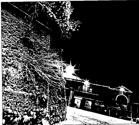
Anche quest'anno torna il suggestivo trenino che collegherà le vie del centro storico al Globo... niente da fare per il grande abete di piazza Martiri, rimpiazzato da tanti piccoli alberelli disseminati per la città