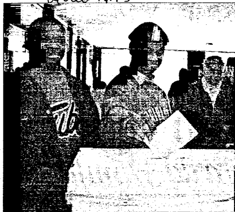
Affluenza alta nel lughese dove Massa Lombarda segna il record della provincia con il 62,5% di elettori del centro-sinistra che si sono recati alle urne