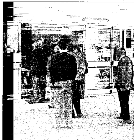
Elettori in fila a un seggio di Alfonsine. Nel Comune hanno votato oltre tremila persone