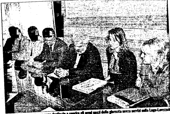
Le nuove corse su gomma sono destinate a coprire gli ampi spazi della giornata senza servizi sulla Lugo-Lavezzola

dicamente, con un percorso che serve sia i centri urbani che le frazioni, in modo da poter essere fruito da una ampia utenza". Ha poi ricordato l'attenzione rivolta ad affrontare i trasporti scolastici, laddove è emersa la necessità di un potenziamento, cercando di far fronte, con corse aggiuntive, alle esigenze. Così è stato nei collegamenti diretti a Riolo per favorire gli allievi