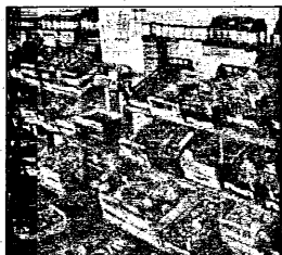
L'appuntamento è per domenica, dalle 10 alle 18

Sono previsti una trentina di espositori: tutte aziende locali,