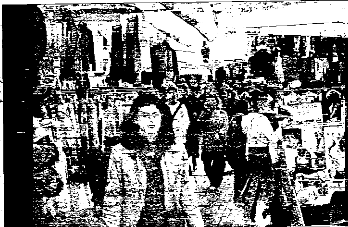
naletta. Il secondo percorso parte da via Canaletta, prosegue nelle vie De Brozzi, Foro Boario e Acquacalda per poi percorrere viale Dante, Largo Gramigna, di nuovo viale Dante, via Cappucci, viale Europa e chiudere la corsa in via Toscana. Il costo

LUGO - Si migliora l'accesso al centro urbano non solo con il nuovo servizio di bici pubbliche, ma anche con i nuovi percorsi e una nuova fermata del Mercabus, in occasione del mercato settimanale del mercoledì. L'Amministrazione comunale, al fine di valorizzare ulteriormente il parcheggio di Largo Gramigna e, allo stesso tempo, fornire ai cittadini intenzionati a dirigersi al mercato settimanale lughese del mercoledì un migliore servizio, ha stabilito di estendere il percorso della linea di trasporto pubblico "Mercabus" creando una nuova fermata. A partire da mercoledì 21 settembre dunque, vengono attivati i nuovi percorsi del Mercabus. La prima tratta percorre via Toscana, viale Europa, via Cappucci, viale Dante, Largo Gramigna, viale Dante, via Acquacalda, via Foro Boario e via De Brozzi, per concludere il percorso in via Ca-