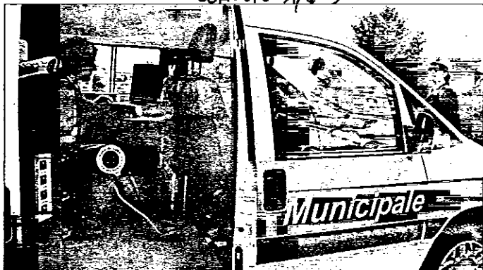
I pattugliamenti notturni proseguiranno anche in settembre