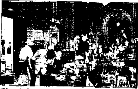
"Mercoledì sotto le stelle" anche in agosto? Visto il successo un'ipotesi più che plausibile