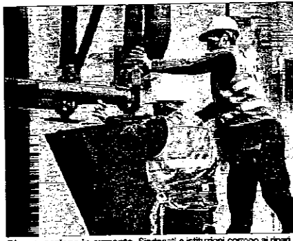
Disoccupazione in aumento. Sindacati e istituzioni corrono ai ripari approntando un piano specifico per la Bassa Romagna