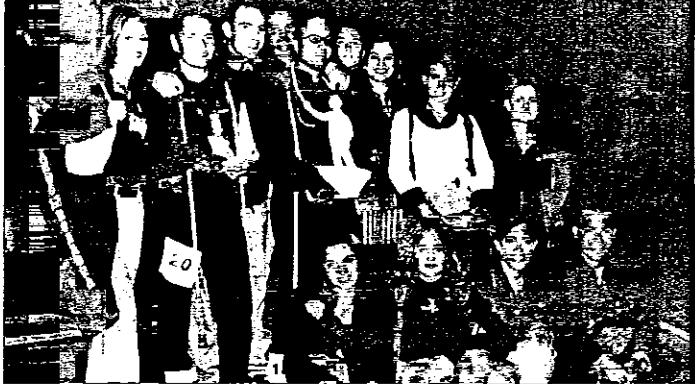
Sono in diciotto Ambiscono al turnover visti i molti impegni