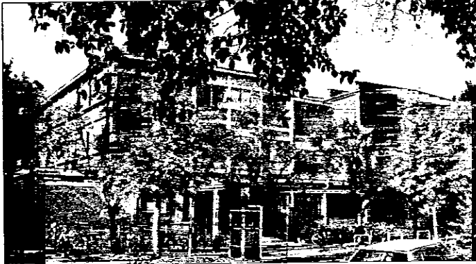
Interventi di bonifica e restauro degli elementi in calcestruzzo e della copertura dell'aula magna. Quali saranno, quindi gli interventi?