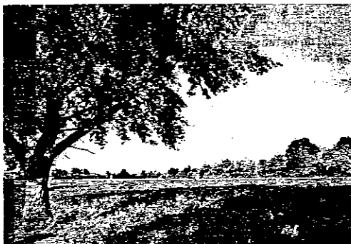
L'area Canale dei Mulini

moderna è percorsa in gran parte da insicurezze e difficoltà di reddito; tra i giovani, in particolare, esiste un'emergenza sociale che riguarda proprio le abitazioni visto che, negli ultimi 5 anni, gli affitti ed i costi delle case hanno subito un aumento quantificabile attorno al 30/40%. Le varianti al Prg adottate dalla giunta mirano a contribuire alla soluzione di questo problema sempre più pressante".