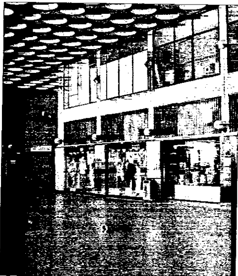
Un'immagine della Galleria della Banca in pieno centro a Lugo

LUGO - I mercoledì sotto le stelle portano a Lugo un numero di visitatori da primato, in questi giorni la rassegna che evoca Cronin si vestirà anche di suggestioni shakespeariane grazie alla "Festa d'estate", che non cade di mezza stagione... ma tanti. Scherzi a parte, il centro si anima e si mette il vestito buono. Buon segno di vitalità, non solo per il commercio. Ma c'è anche il rovescio della medaglia, un particolare che stride, che è sotto gli occhi di tutti e forse anche per questo finisce per passare inosservata. Se vi trovate a passeggiare per il centro della città, osservate bene: c'è il Pavaglione che echeggia di suoni, che è un viavai di gente tra bancarelle e vetrine illuminate; la stessa cosa vale per le vie del centro, la via Baracca e la via Garibaldi si prestano allo "struscio" tipico di ogni città. E poi c'è anche il cordone di folla che lascia i portici per attraversare la piazza e finire dentro la Rocca, tra spettacolini - invero un po' penalizzati dal via vai - e buoni odori-sapori che portano direttamente nel Giardino pensile. Dove sta l'errore? vi starete chiedendo? Guardate meglio... volge-