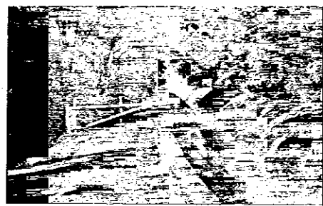
Il Canale dei Mulini: si chiede una chiara presa di posizione

LUGO - In concomitanza con l'assemblea generale dei soci, tenutasi ieri, gli esponenti del comitato "Derrier Regard" e del circolo Legambiente, facendosi forza del vasto consenso riscosso nel corso dell'incontro svoltosi la settimana scorsa, in una lettera aperta indirizzata al presidente della Fondazione Cassa di risparmio e Banca del Monte di Lugo, al presidente della "Lugo immobiliare Spa" e ad oltre 100 soci della Fondazione, chiedono una chiara presa di posizione in merito alla lottizzazione prevista a margine del Canale dei Mulini. Il documento, in breve, è formulato per conoscere la posizione della Fondazione nei confronti della "Lugo immobiliare Spa", e si domanda di valutare