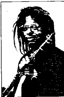
L'americano Don Byron