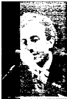
Marco Travaglio, autore dell'attuale settimanale "L'odore dei soldi"

Marco Travaglio è nato a Torino nel 1964. Ha iniziato la sua carriera al "Giornale" con Indro Montanelli e lo ha seguito quando quest'ulti-