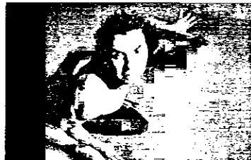
La Tana in scena a Lugo

LUGO - Va in scena questa sera (ore 21, nel teatro del Sacro Cuore in via Emaldi 80), con il patrocinio del Comune di Lugo, lo spettacolo di Wilson Juliao "La Tana/ a Construcao". Un evento che ha il sostegno del Comitato di Solidarietà per Sao Bernardo e dell'Associazione Amici di Sao Bernardo. Si tratta di una produzione della Cooperativa Paulista del Teatro e del Centro di Formazione Professionale Padre Leo Commissari di Sao Bernardo do Campo.