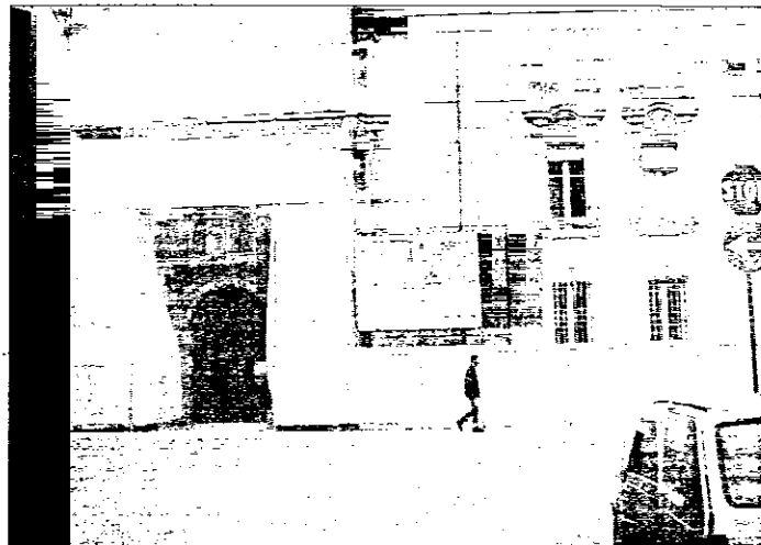
I lavori in corso su Palazzo Rossi. Termineranno entro la fine del 2006

ro l'attuale via Matteotti, e quello secondario, cioè via Risorgimento. Appartenne prima ai Conti Rossi, una delle principali famiglie di Lugo già nel '600, poi passò ai Tellarini, ai Locatelli, ai Tamba e nel 1919 fu acquistato dal Partito Repubblicano che vi installò la propria sede, poi passò alla Provincia di Ravenna, e fu sede delle Poste e infine della Pretura. Acquisito poi dal Comune, il Palazzo ha inoltre ospitato, fino all'inizio dell'intervento di ristrutturazione, il centro di igiene mentale dell'Ausl e, sul retro, la Polizia di Stato, ora trasferirsi rispettivamente in viale Masi e in via Emaldi. L'intervento, iniziato nel dicembre 2002, si concluderà entro il 2006, e il Tribunale, attualmente 'in tra-