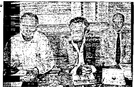
L'iniziativa è stata presentata ieri mattina in Municipio

r'altro a diffondere, in modo capillare, una massa di informazioni di estremo interesse. Sarà affisso in cinque postazioni centralissime: nelle bacheche del Pavaglione, all'ingresso della Rocca, della Biblioteca comunale, dell'Ufficio relazioni con il pubblico, dell'Ipercoop. Nelle frazioni sarà diffuso in formato più ridotto". A seguire, a cura dei curatori Corbolante e Brunetti, la descrizione del progetto grafico, (folder, depliant e la cartina della città), realizzato secondo tre caratteristiche principali: "la semplicità nelle forme e nella suddivisione degli argomenti; l'immediatezza nella lettura e nella comprensione delle informazioni proposte; l'eleganza