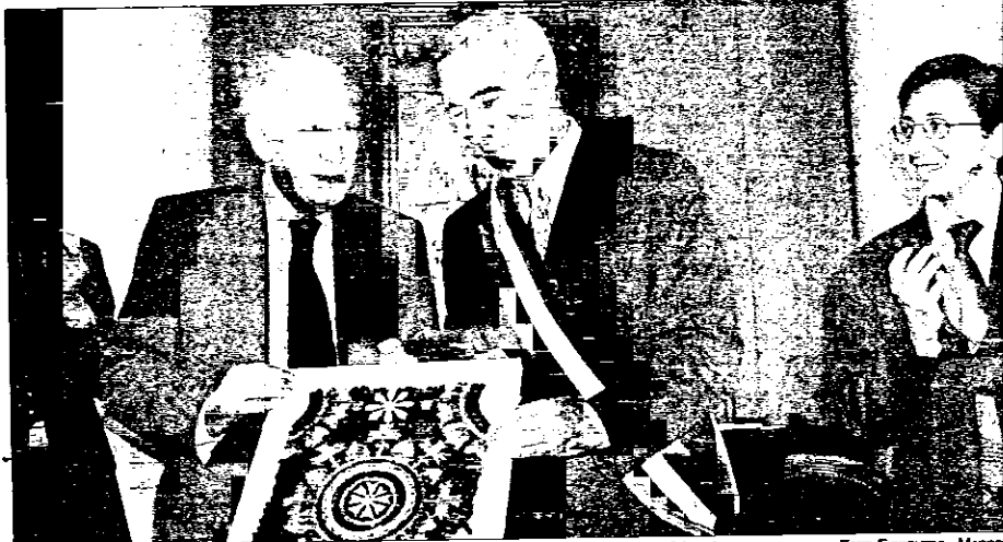
Sopra: Luzi insieme al sindaco durante il conferimento della cittadinanza onoraria. Sopra: un primo piano del poeta