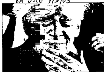
dinanza lughese esprimo il più vivo cordoglio per la improvvisa scomparsa del Senatore Mario Luzi. Il suo impegno civile, la sua opera letteraria e il

dopo aver ricevuto la risposta positiva del Poeta. Il suo sarebbe stato un ritorno. La favola di pace di Lugo, purtroppo, lo avrà presente solo nello spirito, anche se la "materia" che Luzi lascia in eredità non morirà mai. Il sindaco di Lugo Raffaele Cortesi - a nome dell'amministrazione della città, ha inviato un telegramma di cordoglio. Questo il testo: "A nome mio personale, dell'Amministrazione comunale e dell'intera città-