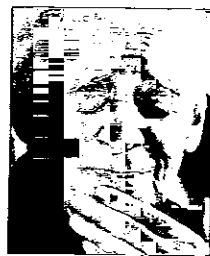
Alle pagine 15 e 21